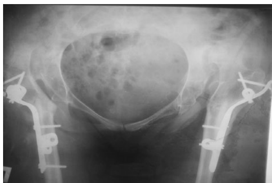
Рис. 4-а. Рентгенограмма больной с врожденным вывихом бедра после операции