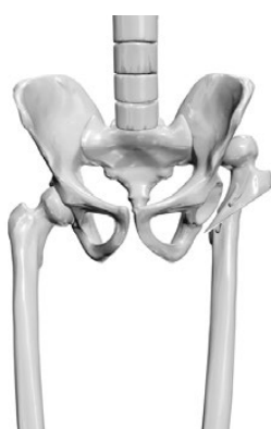
Рис. 3-б. Схематическое изображение новой методики удлиняющей опорной остеотомии левого бедра