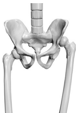
Рис. 3-а. Высокий врожденный вывих левого бедра