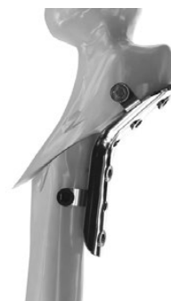
Рис. 3-в. Схематическое изображение методики фиксации фрагментов левой бедренной кости

операции и продолжается в амбулаторных условиях. Нагрузка на конечность разрешается через 2,5–3 мес. после операции.