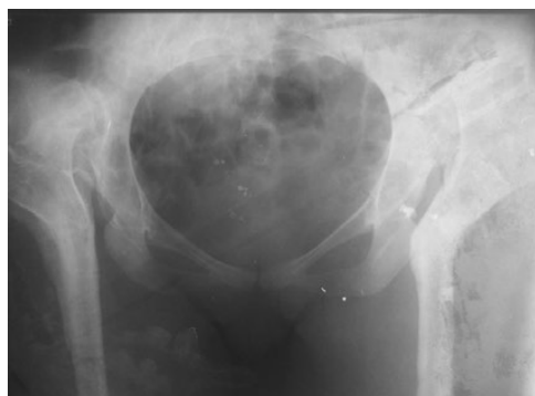
Рис. 4-б. Рентгенограмма после удаления металлоконструкции через 10 лет после операции

тазовой кости при создании точки опоры на передненижний край вертлужной впадины, исчезают проявления локального остеопороза, нарастает структура костной массы таза.