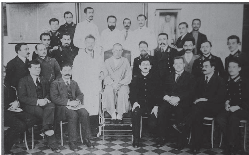
Рис. 4. В.Ф. Бургсдорф с больным и коллективом (стоит рядом с больным в халате), 1908 г.

светолечения. Некоторые увеличенные почти до естественных размеров фотографии из него были продемонстрированы впоследствии на одном из Пироговских съездов [4, 6].