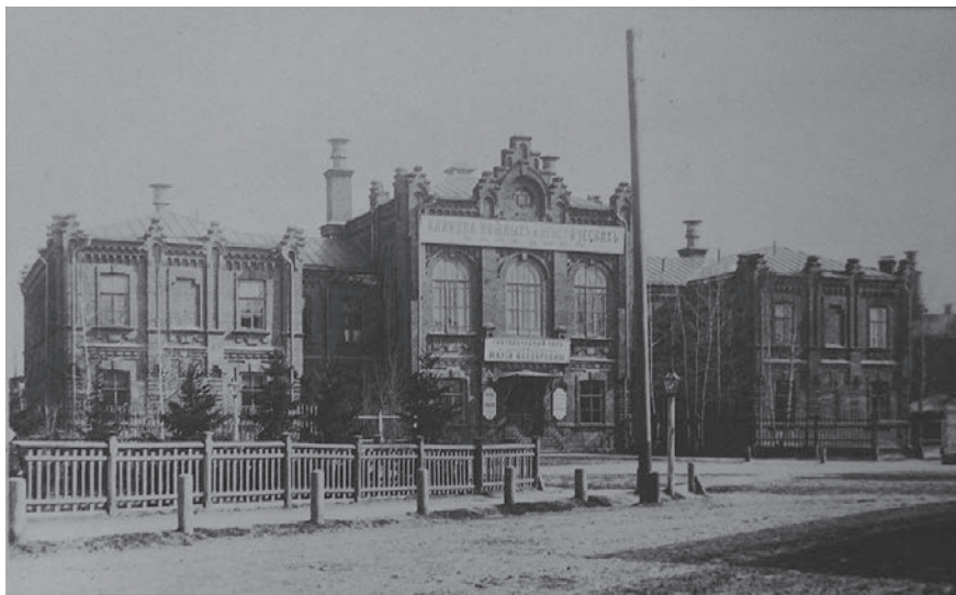
Рис. 2. Клиника кожных и венерических болезней профессора А.Г. Ге, 1910 г.

Вторая техническая революция совпала с индустриализацией. Характерными чертами развития были широкое применение электричества и других новейших достижений науки и техники.