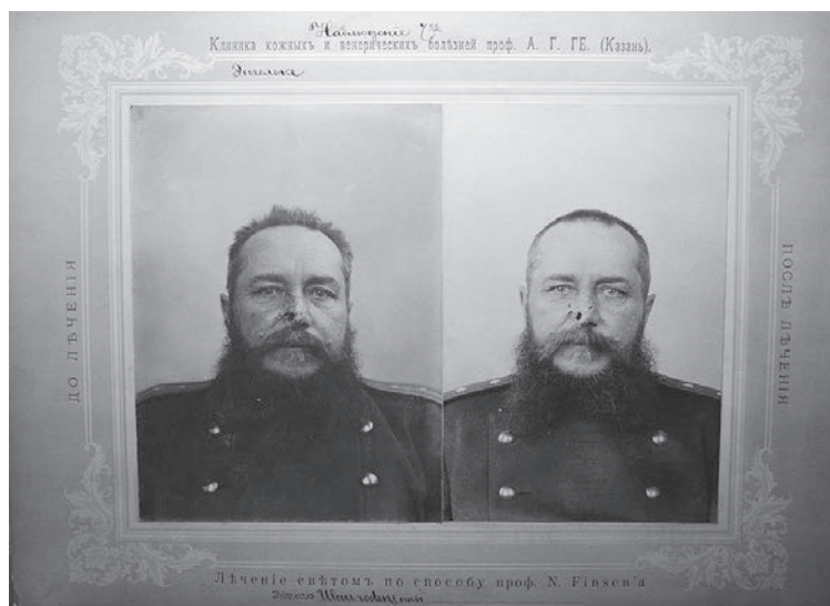
Рис. 3. Снимок больного из атласа фотографий

ских клиник и введением нового штатного расписания 27 января 1900 г. В.Ф. Бургсдорф был переведён на место штатного ассистента [4]. Вскоре медицинский факультет университета, заинтересованный в успехах применения лучистой энергии в лечении кожных заболеваний, удостоил В.Ф. Бургсдорфа чести быть командированным от его имени в Копенгаген. Там незадолго до того был основан Световой институт N.R. Finsen, куда и был направлен В.Ф. Бургсдорф для непосредственного изучения новой формы фототерапии. Эта поездка определила направление дальнейшей профессиональной деятельности В.Ф. Бургсдорфа.