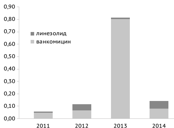
Рис. 3. Потребление ванкомицина (J01XA01) и линезолида (J01XX08), установленная суточная доза/100 койко-дней, 2011–2014 гг.

Обсуждение. Показатели потребления антибиотиков в больнице сопоставимы с их потреблением в многопрофильных стационарах РФ и Белоруссии [1, 20, 21]. Лидерами по назначениям так же, как и в подавляющем большинстве стационаров РФ, остаются цефалоспорины III поколения без антисинегнойной активности (цефтриаксон, цефотаксим). Доля их назначений в отдельных стационарах достигала от 28 до 60% всех назначений антибактериальных средств [7, 15, 20]. Злоупотребление цефалоспоридами опасно из-за возможного развития так называемого «параллельного ущерба», приводящего к селекции полирезистентных