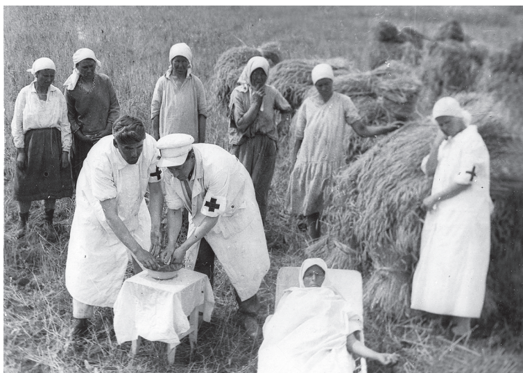
Рис. 4. Заготовка крови на сельскохозяйственном предприятии в полевых условиях

женицы сельских районов Татарстана (рис. 4). 10 девушек и женщин Кузнечихинского района обратились к трудящимся района с коллективным письмом: «Мы, девушки и женщины, честно работая в тылу, решили быть ещё более активными участниками победоносной Отечественной войны. Поможем нашим товарищам и братьям, доблестным бойцам Красной Армии, пострадавшим от вражеских пуль и снарядов, восстановить пролитую кровь. Вступаем в ряды доноров».