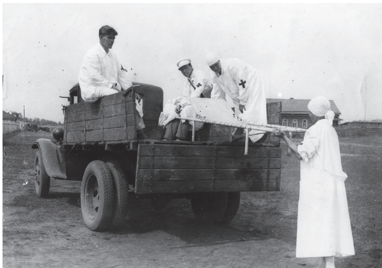
Рис. 1. Заготовка крови передвижными донорскими пунктами

потеряла 72% раненых, 90% заболевших на поле боя.