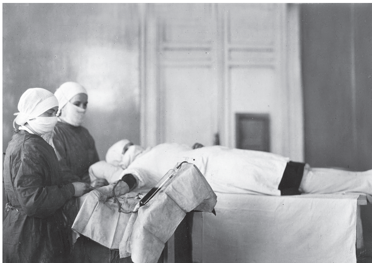
Рис. 3. Забор крови на одном из предприятий города Казани